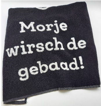
Duschtuch 19,50 €