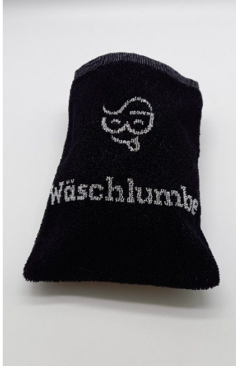
Wash- handschuh 4,70 €