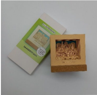
Silhouette 12,90 € Saarbrücken Motivstecksatz