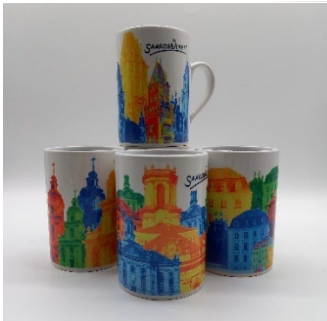
Tasse Pop Art 8,90 € Verschiedene Motive Rathaus, Ludwigskirche, Schloss, Basilika