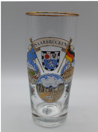
Bierglas 0,25 l 4,20 €