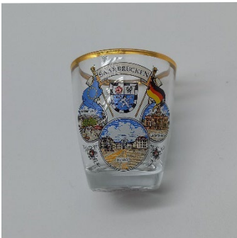
Schnapsglas 2,10 €