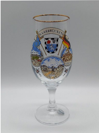
Biertulpe 5,90 € 0,3 l