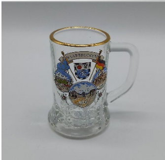
Schnapskrug 3,50 €