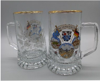
Bierkrug 7,50 € 0,4 l