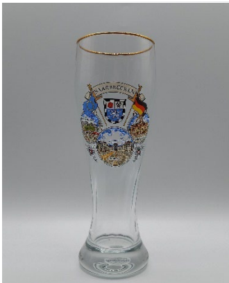
Weizenbiertglas 5,90 € 0,5 l