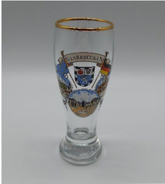
Schnapsglas 3,70 € Weizen