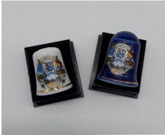
Fingerhut 3,50 € Porzellan, weiß oder blau