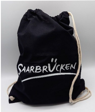
Turnbeutel 9,90 € Baumwolle, schwarz