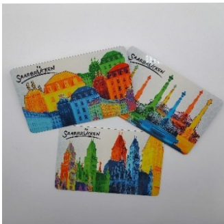
Brettchen Pop Art 8,50 € Art Verschiedene Motive: Rathaus, Ludwigskirche, Schloss, Basilika, Brunnen St. Johanner Markt, & Theater